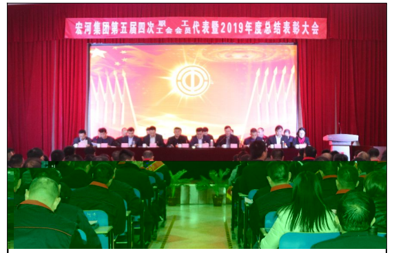
1 a 19日, 宏河集团第五届四次职代会(工代会)暨2019年度总结表彰大会在横河煤矿职工bc召开。

! " # $ % & ' ( ) * + , ) * - . 2019 / 01 2345 * 67, 89: +; <-